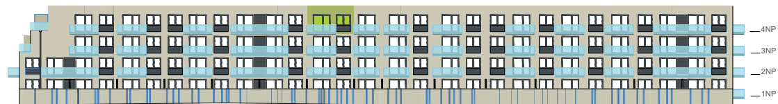
Jižní pohled na dům / Building View - south side