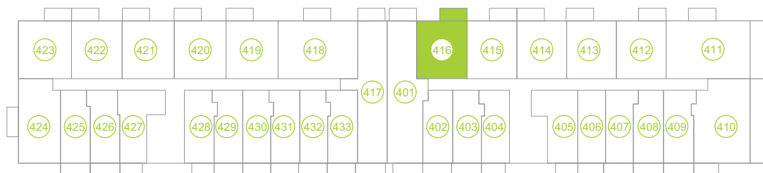
Půdorys podlaží / Floor plan